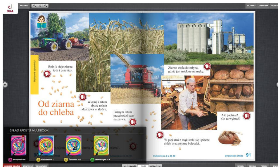
Rys. 1. Zrzut ekranu multibooka Wydawnictwa Juka [Juka 2013]

Jak widać, aby móc korzystać na lekcji z takiego środka dydaktycznego, nauczyciel musi dysponować odpowiednim sprzętem w sali. Aby w podstawowym zakresie korzystać z multibooka, wystarczy, żeby sala była wyposażona w komputer lub laptop oraz rzutnik multimedialny. Takie wyposażenie sali w zupełności wystarczy nauczycielowi, który będzie chciał jedynie prezentować uczniom materiały dostępne dzięki multibookowi. Jednak aby w pełni wykorzystać możliwości, jakie oferuje ten środek dydaktyczny, niezbędna jest tablica interaktywna. Dzięki takiemu wyposażeniu pracowni uczniowie mogą z większym zaangażowaniem uczestniczyć w lekcji, a takie połączenie sprzętu i oprogramowania „zapewni interaktywną pracę uczniów w klasie” [NowaEra 2013].